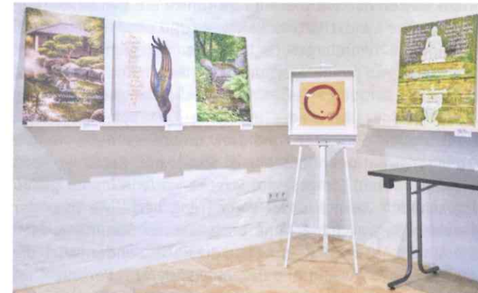
Fernöstlich anmutende Textkunst mit farbprächtigen Hintergrundmotiven sind zur Zeit in der Ausstellung

feine Leinwanddrucke, die ausdrucksstarke Pinselstriche mit asiatisch anmutenden Naturfotografien verbinden – atmen den Geist des Zen-Buddhismus und des Taoismus. Der zentrale buddhistische Leitgedanke „Leere ist Form und Form ist Leere“ zieht sich wie ein roter Faden durch die Räume. Das Faszinierende an Frau Piepers Arbeiten ist ihre trügerische Mühelosigkeit. Was auf den Betrachter wirkt wie ein flüchtiger, eleganter Moment, ist das Ergebnis jahrzehntelanger Disziplin. Sie selbst vergleicht es gern mit dem Eiskunstlauf: Die Tänzer gleiten scheinbar schwerelos über das Eis, drehen sich voller Selbstverständlichkeit – und doch steckt dahinter harte,