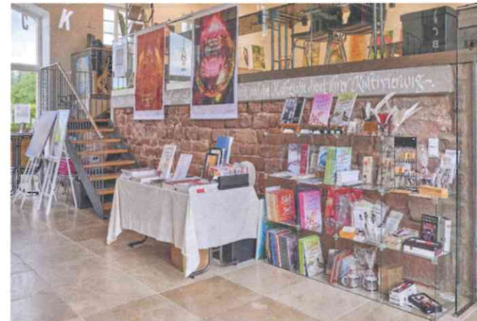
Der Vorräum im Gut Königsbruch beim eingetragenen Verein „Stiftung Schriftkultur e.V.“

hierher kommt, lässt die Hektik der Welt augenblicklich hinter sich. 1766 von Christian IV. von Dänemark und Norwegen gegründet und eng mit der Historie unserer Region verwoben, drohte das geschichtsträchtige Anwesen einst zu verfallen. Doch dank einer liebevollen Sanierung strahlt es seit einigen Jahren erneut in altem Glanz. Heute teilt sich die Idylle ein