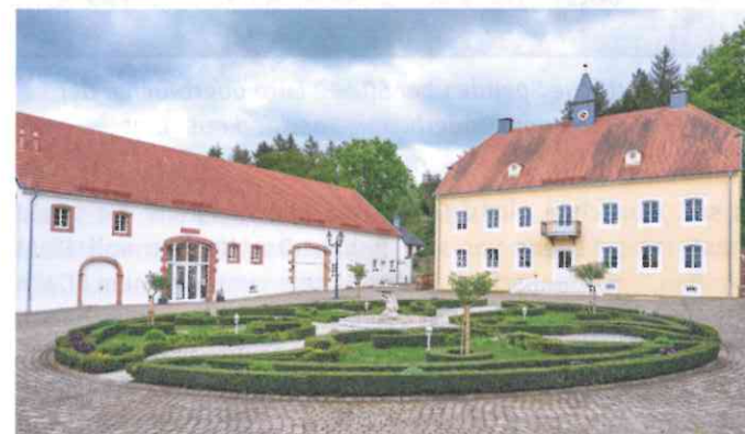
Das Gut Königsbruch in Bruchhof

ganz besonderes Ensemble: Während draußen auf den saftigen Wiesen verunfallte Wildschweine oder gerettete Schafe ein friedliches Leben auf dem dortigen Gnadenhof genießen, zieht drinnen in den ehemaligen Scheunenräumen eine ganz leise, aber kraftvolle Kunst ihre Kreise. Hier hat die Diplom-Designerin und Schriftkünstlerin Katharina Pieper mit ihrer